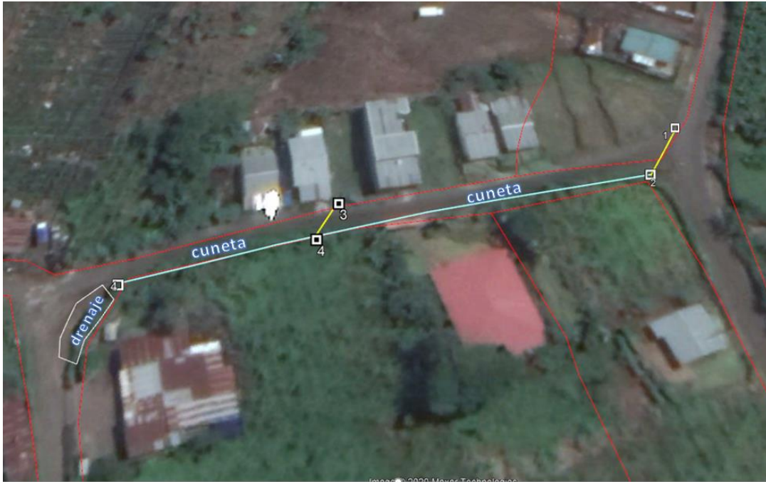
Ubicación de obras en sitio, según tabla de cantidades