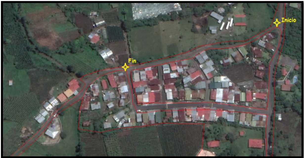
Proyecto Barrio La Esperanza