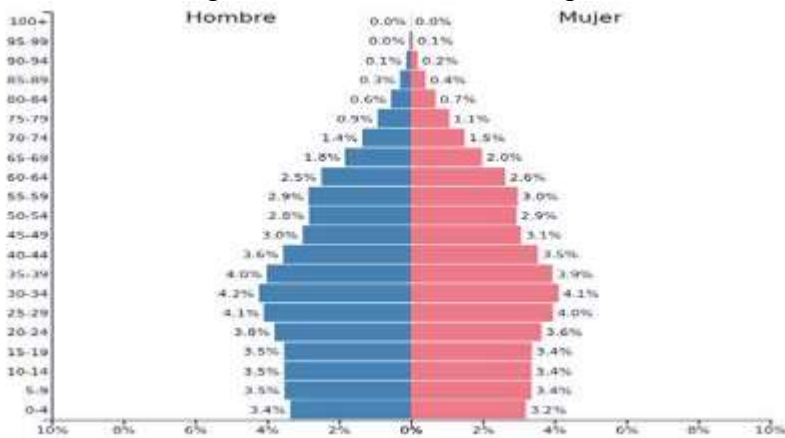
540 541 Figura 1. Estructura poblacional de Costa Rica al 2022. Fuente: PopulationPyramid 542 (2022)

538 gobernabilidad del país, manifestados en la transformación de la pirámide 539 poblacional, según se observa en la imagen núm.1 a continuación: