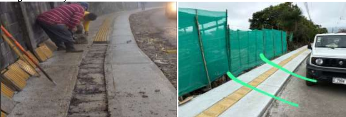
508 Imagen No. 11 y 12 Errores constructivos 509

510 5. La empresa Constructora Presbere S.A, a la fecha de vencimiento del contrato, 511 no concluye los siguientes proyectos: