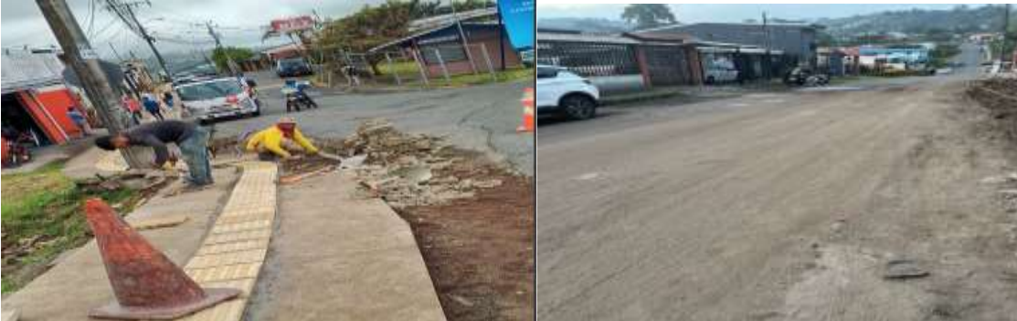
506 Imagen No. 9 y 10 Errores constructivos 507

503 4. Errores constructivos: omisión de accesos peatonales y vehiculares, instalación 504 incorrecta de losetas táctiles, las cuales debieron ser removidas y reinstaladas en 505 cuatro ocasiones en un mismo tramo.